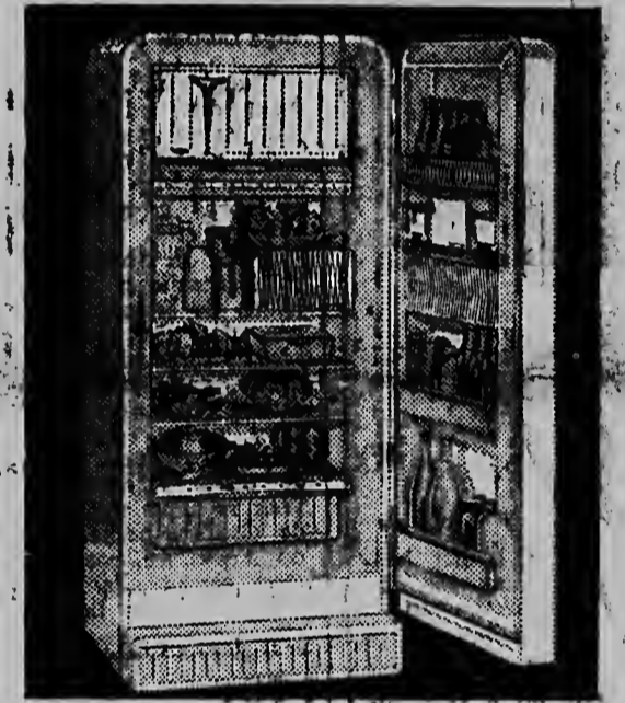
Model S-101-56 The superb 10.1 cu. ft. S-101-56